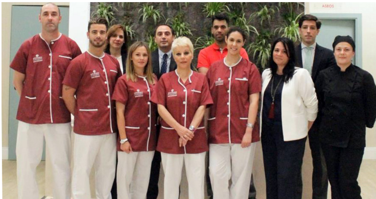
Equipo Técnico del Centro Fundomar San Isidoro

El equipo de trabajo de Centro de Mayores San Isidoro lo integran personas que se esfuerzan diariamente en mejorar el cuidado de nuestros mayores, contando con los mejores profesionales que nos permiten cumplir el objetivo que nosotros mismos nos hemos marcado: Dar la mejor atención posible a nuestros mayores.