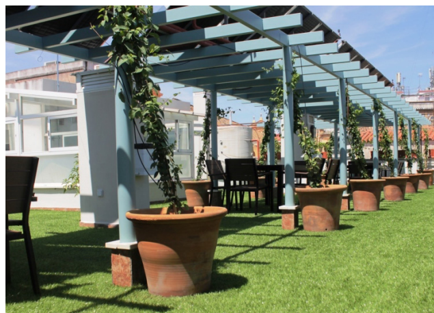
Terraza / Solarium

Garantizar la calidad de vida de nuestros mayores. Todas sus habitaciones están dotadas de sistemas antincendios, climatización, teléfono, smart TV y satélite, servicio mini bar y sistema de comunicación directa con nuestro personal.